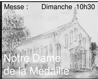
Notre Dame de la Médaille