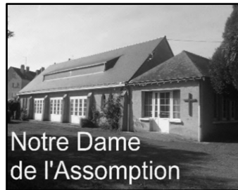
Notre Dame de l'Assomption

St Pierre des Corps - La Ville aux Dames