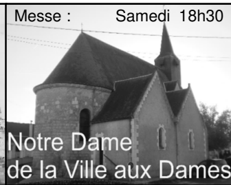
Notre Dame de la Ville aux Dames