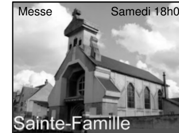
Messe Samedi 18h00 Sainte-Famille