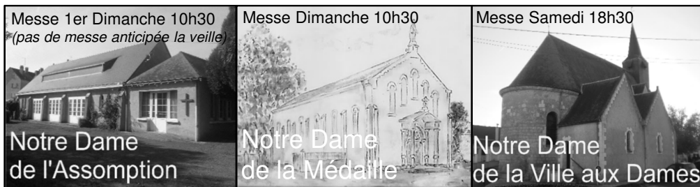
Messe 1er Dimanche 10h30 (pas de messe anticipée la veille) Notre Dame de l'Assomption