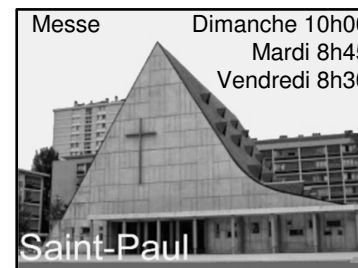
Messe Dimanche 10h00 Mardi 8h45 Vendredi 8h30 Saint-Paul