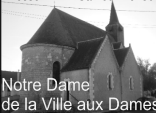
Notre Dame de la Ville aux Dames

Accueil au Presbytère : Samedi de 09h00 à 12h00