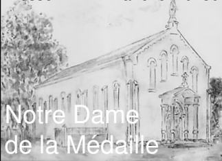
Notre Dame de la Médaille